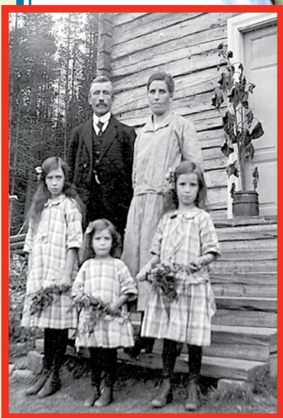
Systrarna Karlsson's familj. foto från 1925

Länsstyrelsen i Norrbotten 0920-96000 www.bd.lst.se